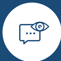
Visibility & Collaboration